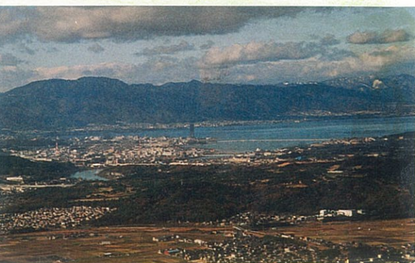
湖南アルプスからのながめ