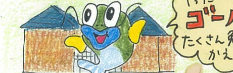
水のめぐみ館 アクア琵琶