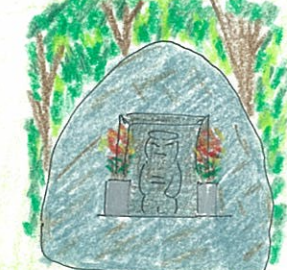
至 泣不動・不動寺 (田上山山頂)